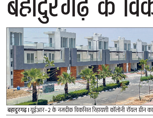
बहादुरगढ़। यूईआर-2 के नजदीक विकसित रिहायशी कॉलोनी रॉयल ग्रीन काउंटी।

हरिभूमि न्यूज ►► बहादुरगढ़ यूईआर-2 के शुरू होने से बहादुरगढ़ और सोनीपत के विकास को नई गति मिलना वय है। दिल्ली के अलीपुर स्थित एनएच-44 से शुरू होकर यह सड़क रोहिणी, मुंडका, नजफगढ़, द्वारका होते हुए महिपालपुर के पास एनएच-48 तक जुड़ेगी। इस बवना से सोनीपत और दिचाऊ से बहादुरगढ़ तक कनेक्ट किया गया है। यूईआर-2 से हरियाणा के बहादुरगढ़ और सोनीपत का दिल्ली एयरपोर्ट, द्वारका, रोहिणी,