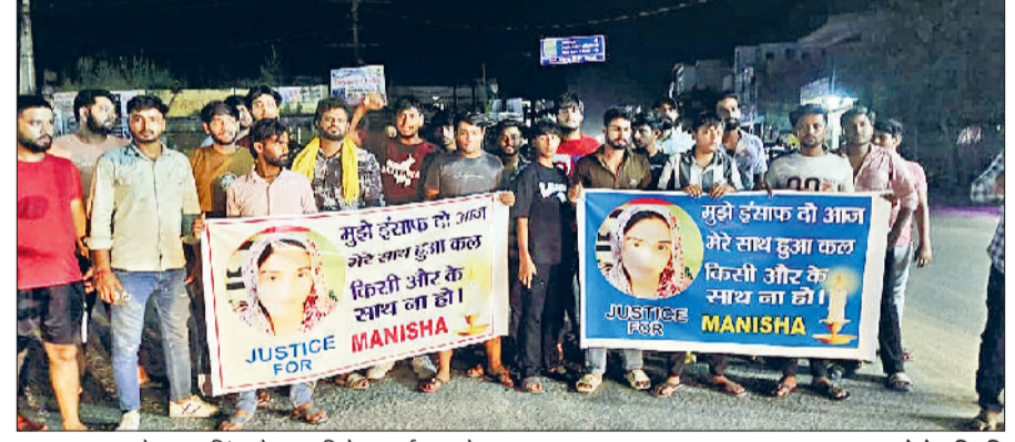
झज्जर। शहर के भगत सिंह चौक पर विरोध प्रदर्शन करते हुए युवा।