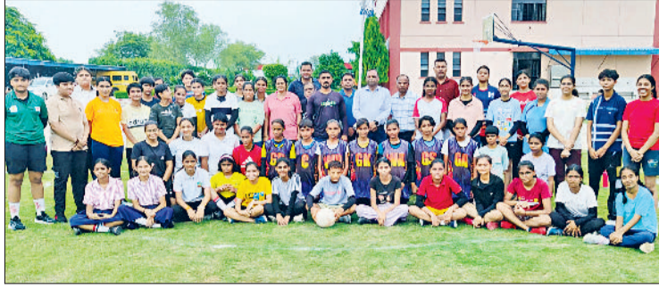
झज्जर। शिक्षकों के साथ उपस्थित विजेता खिलाड़ी।