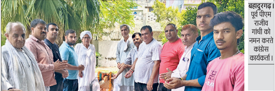
बहादुरगढ़। पूर्व पीएम राजीव गांधी को नमन करते कांग्रेस कार्यकर्ता।