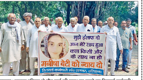
झज्जर। जलधर परिसर से मौन मार्च की शुरुआत करते हुए रिटायर्ड कर्मचारी।