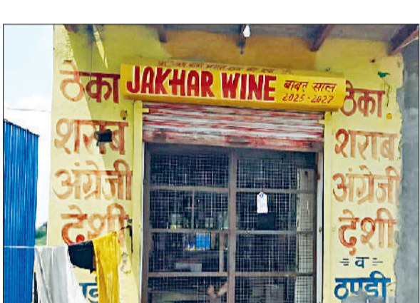
झज्जर। दाणा गांव स्थित शराब का टेका।

सीएम फ्लाईंग, स्थानीय गुप्तचर विभाग और आबकारी विभाग की टीम ने गांव दाणा में अवैध रूप से चले रहे शराब के टेके पर छापेमारी की गई है। सीएम फ्लाईंग गुप्तचर विभाग और आबकारी विभाग की संयुक्त टीम ने सूचना मिली थी कि दाणा गांव में