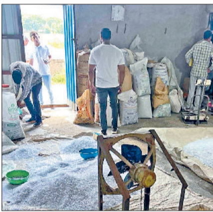
बहादुरगढ़। अवैध फैक्ट्री में हो रही प्लास्टिक रिसाइलिंग।

स्पेशल एन्वायरन्मेंटल सर्विलांस टास्क फोर्स (एसईएसटीएफ) ने बुधवार को शहर के निजामपुर रोड पर 5 अवैध इकाइयों में छापेमारी की। संयुक्त टीम ने तमाम साक्ष्य जुटाने के साथ ही अवैध फैक्ट्री संचालकों को शोर्काज नोटिस जारी किया है। परनाला के निजामपुर रोड पर एसईएसटीएफ की टीम ने बुधवार को बड़ी कार्रवाई करते हुए 5 अवैध औद्योगिक इकाइयों पर छापेमारी की। इस संयुक्त कार्रवाई में हरियाणा प्रदूषण नियंत्रण बोर्ड (एचएसपीसीबी), नगर परिषद, सिंचाई विभाग, पंचायत राज विभाग, उत्तर हरियाणा बिजली