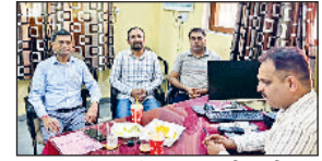
झज्जर। बैठक में उपस्थित पीएनबी ग्रामीण स्वरोजगार प्रशिक्षण संस्थान के पदाधिकारी।