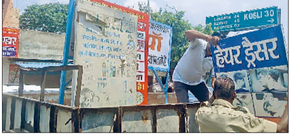
झज्जर। पुरानी तहसील के नजदीक दुकानों के बाहर बोर्ड उतारकर टाली में डालते ट्रैफिक पुलिस व नगर परिषद के कर्मचारी।