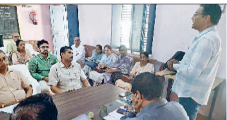
झज्जर। समीक्षा बैठक में उपस्थित क्लस्टर प्रमुख, एबीआरसी व बीआरपी।