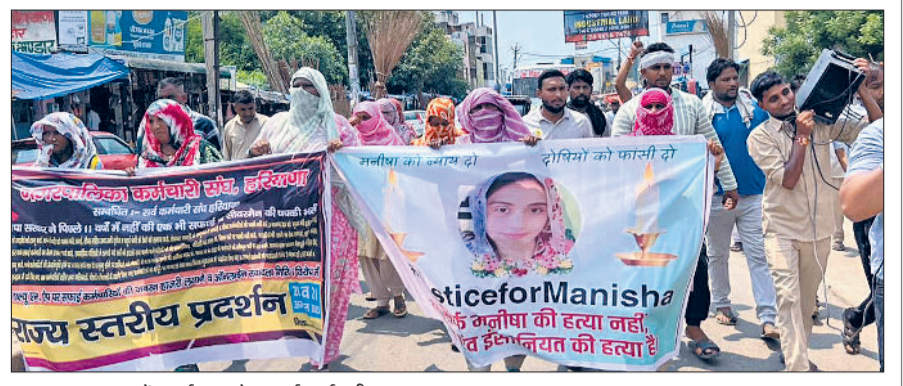
बहादुरगढ़। शहर में प्रदर्शन करते सफाई कर्मचारी।

हरिभूमि न्यूज ►► बहादुरगढ़ नगर पालिका कर्मचारी संघ के आह्वान पर सफाई कर्मचारियों ने बुधवार को उल्टी झाड़ू लेकर विरोध प्रदर्शन किया। यह प्रदर्शन सुबह तुलाराम पार्क से शुरू होकर झज्जर रोड चौक पर समाप्त हुआ। प्रदर्शनकारियों ने मनीषा प्रकरण को लेकर भी सरकार और प्रशासन के खिलाफ नारे लगाए तथा महिलाओं की सुरक्षा को लेकर सवाल खड़े किए।