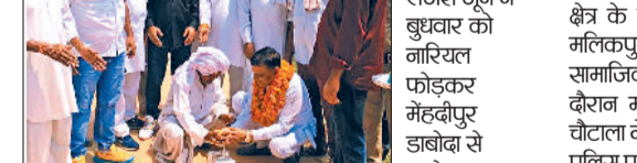
झज्जर। सामाजिक कार्यक्रम के दौरान उपस्थित पूर्व डिप्टी सीएम दुष्प्रंत चौटाला।