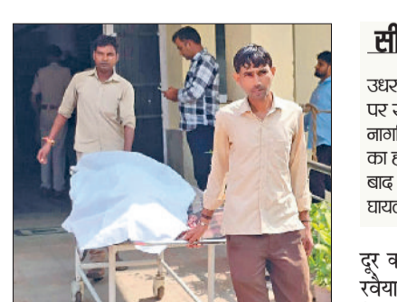
बहादुरगढ़। शव को मोर्चरी में ले कर्मचारी।

तहर लाया जाता है मानों इंसान नहीं, बोरे भरकर ढोए जा रहे हैं। इन्हें अमानवीय परिस्थितियों का परिणाम है कि रास्ते में कई बार दर्दनाक हादसे हो जाते हैं। मंगलवार रात भी बहादुरगढ़ में केएमपी पर ऐसा ही एक हादसा हुआ, जिसमें मजदूरों की जिंदगी, मौत और घायल होने के दर्द में बदल गई। इन्हें पिकअप गाड़ी में टूस-टूस कर भरा गया था।