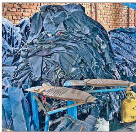
बहादुरगढ़। पकड़ी गई जींस ड्राईंग फैक्ट्री।

वितरण निगम (यूएचबीवीएन) तथा पुलिस विभाग शामिल रहे। जांच के दौरान टीम ने पाया कि इनमें से 4 इकाइयां प्लास्टिक धुलाई व पुनः प्रसंस्करण (रिसाइलिंग) कार्य कर रही थीं। जबकि एक इकाई में जींस ड्राईंग का काम अवैध रूप से चल रहा था।