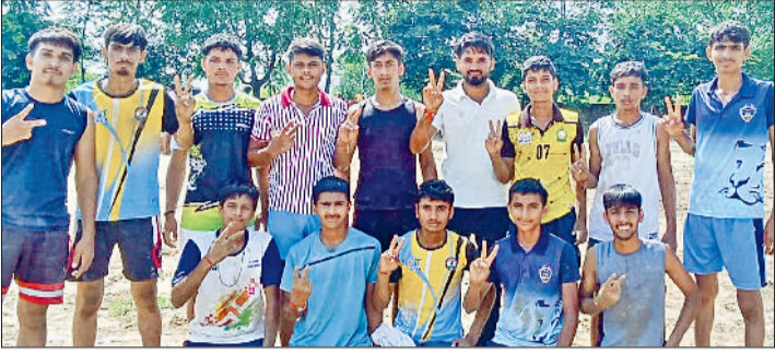
झज्जर। विजय चिन्ह बनाते हुए विजेता खिलाड़ी।