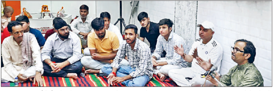
झज्जर। बाबा काशीगिरी मंदिर में सुंदरकांड का सामूहिक पाठ करते हुए श्रद्धालु।