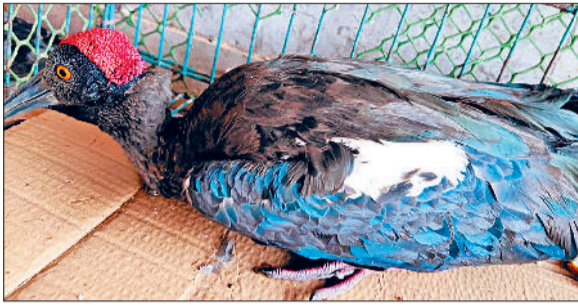
गोधन सेवा समिति के उपचार केंद्र चल रहा उपचार

शहर के सरकारी पशु चिकित्सालय परिसर में आईबिस प्रजाति का पक्षी चाइनीज डोर में उलझकर 80 फुट ऊंचे सफेदे के पेड़ पर फंस गया। पंख बुरी तरह डोर में जकड़े होने के कारण वह फड़फड़ाता रहा लेकिन निकल नहीं सका। जीवप्रेमियों ने इसकी सूचना गोधन सेवा समिति और फायर ब्रिगेड को दी। दोनों टीमों मौके पर पहुंची लेकिन ऊंचाई अधिक होने और अस्पताल गेट से क्रेन न निकल पाने के चलते बचाव कार्य नाकाम रहा। अगली सुबह बुधवार को फिर से प्रयास किए गए लेकिन बात नहीं बनी।